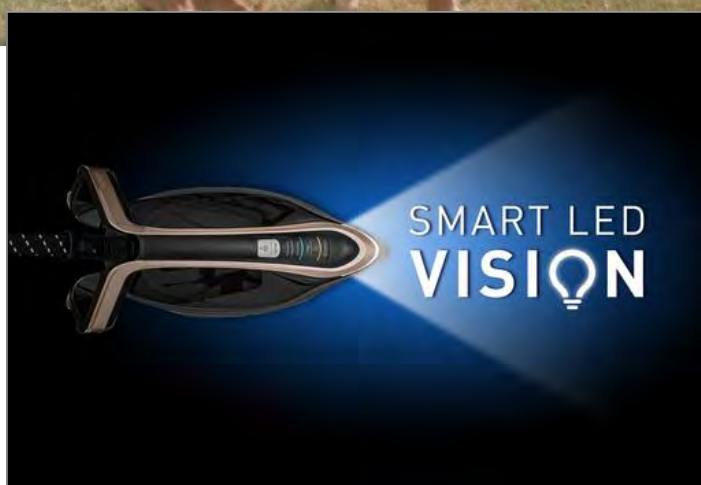
PRO EXPRESS VISION GV9820C0